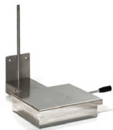
Bowl heater Riscaldatore vasca Système chauffage cuve Calentador de perol Нагреватель дежи