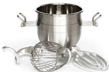
Kit reduction bowl with 3 tools Kit riduzione vasca con 3 utensili Kit réduction cuve avec 3 outils Kit reducción perol con 3 utensilios Набор редукции дежи с 3 инструментами

● AVAILABLE VERSION ● STANDARD ● OPTIONAL × NOT AVAILABLE