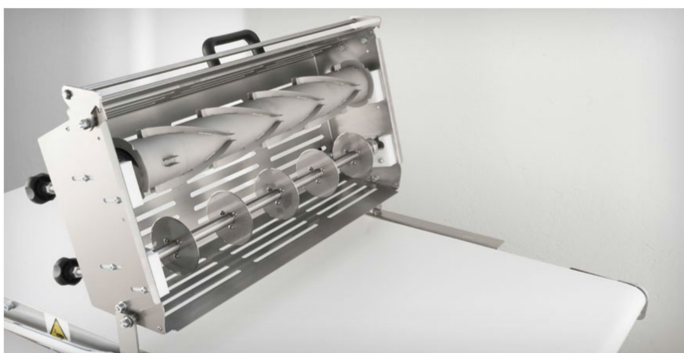
Reinforced table for cutting set (minimum belt length mm.1400) Piano rinforzato per set di taglio (lunghezza minima piani mm.1400) Plan renforcé pour système de découpe (longueur minimal tapis mm.1400) Plano reforzado para dispositivo de corte (longitud mínima cintas mm.1400) Усиленная рама для станции нарезки (устанавливается на машины с длиной ленты не менее 1400 мм)