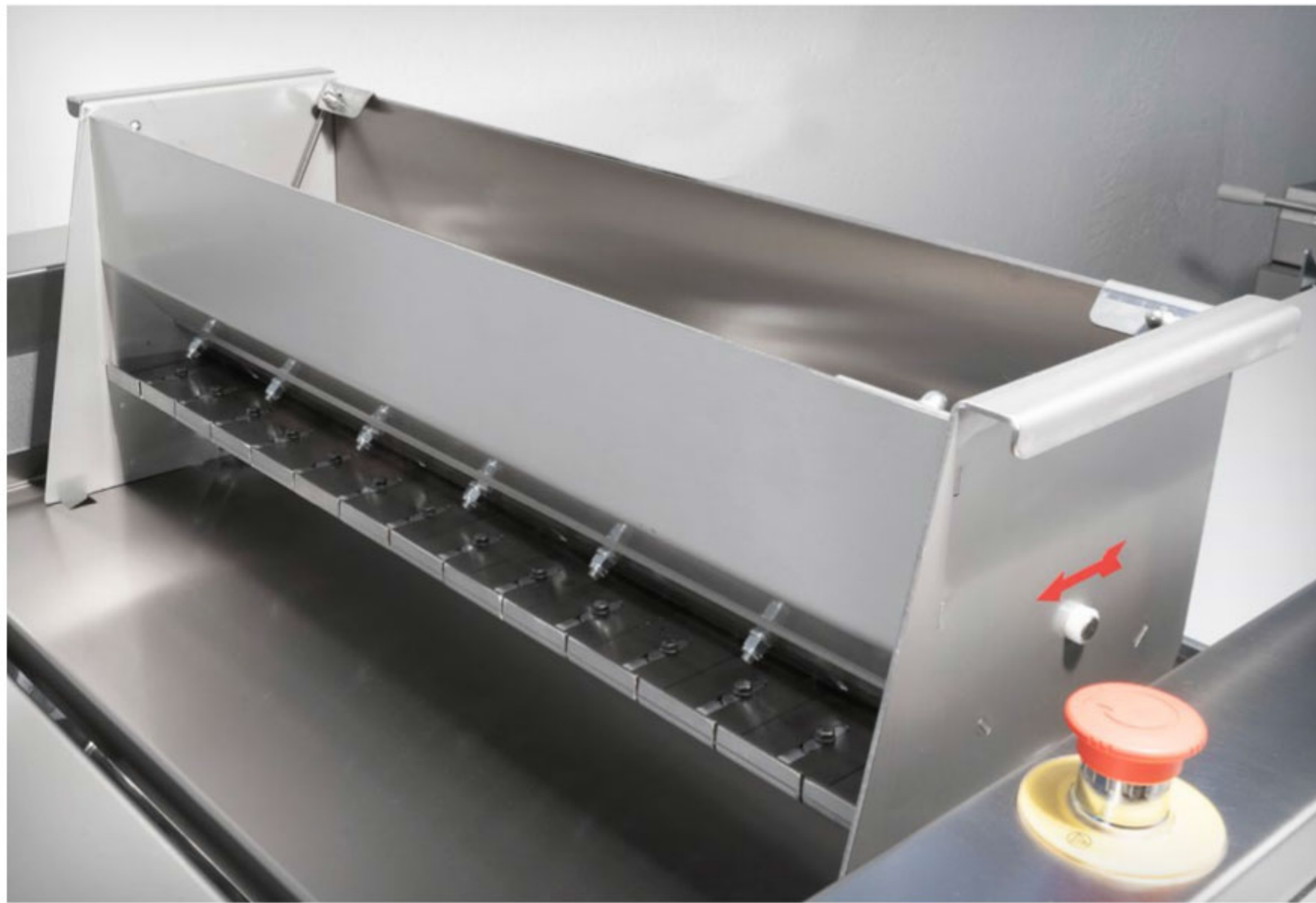
Automatic and removable flour duster Sfarinatore automatico e removibile Farineur automatique et amovible Enharinador automático y extraíble Автоматическая система мукопосыпки