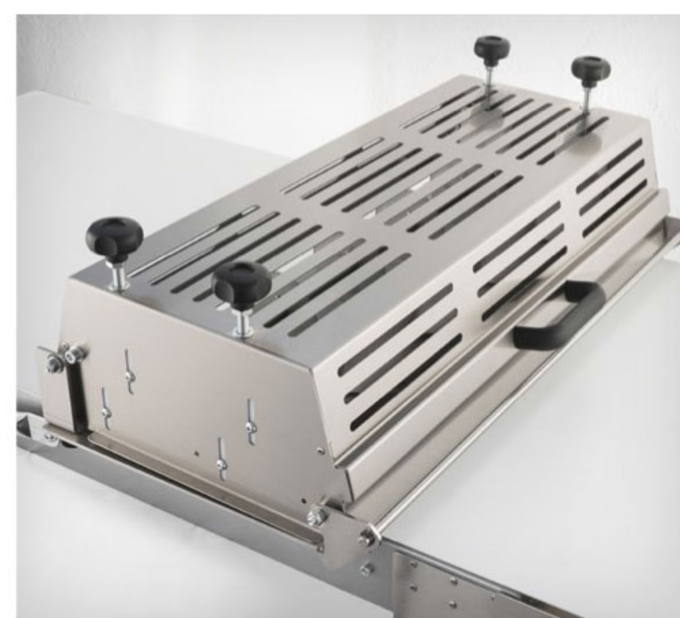
Stainless steel cutting box Box di taglio in acciaio inox Box découpe en acier inox Caja de corte en acero inox Станция нарезки из нержавеющей стали