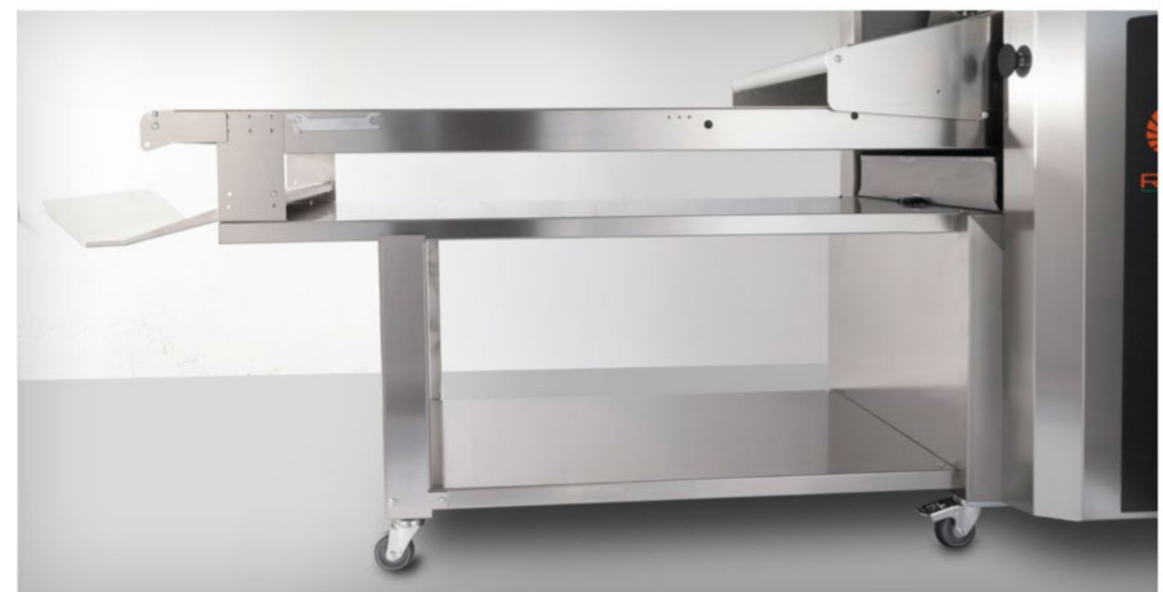
Tables support structure with shelf mounted on wheels (only for 1400) Struttura supporto piani con ripiano montato su ruote (solo per 1400) Structure porte plans avec étagère montée sur roues (seulement pour 1400) Estructura de soporte planes con estante montada sobre ruedas (solo para 1400) Подставка на колесах с полкой (для моделей с длиной ленты не менее 1400 мм)