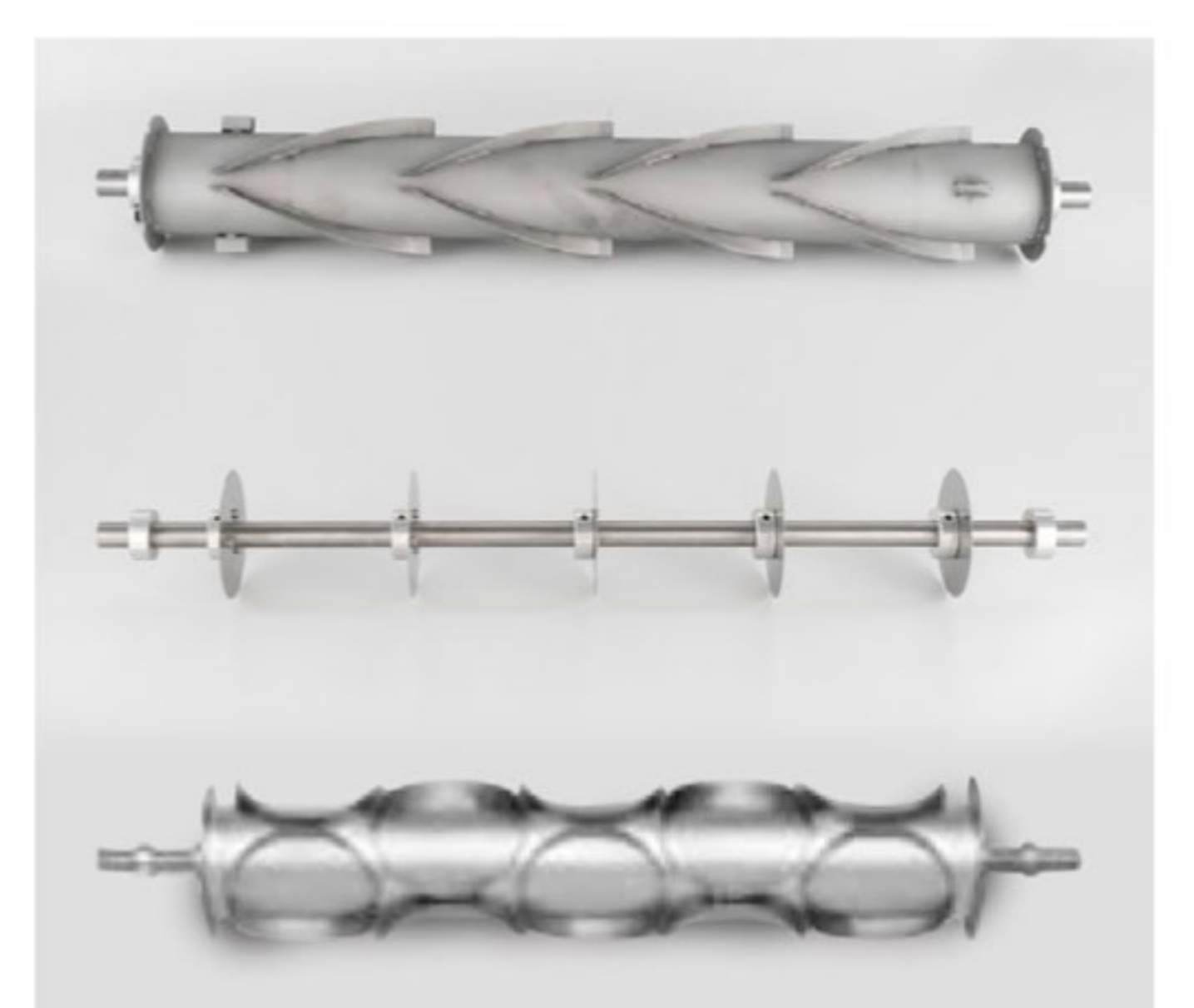
Custom shapes and sizes rollers Rulli di differenti forme e misure Rouleaux de formes et dimensions personnalisées Rodillos de formas y tamaños personalizados Валки нестандартной формы и размеров по запросу