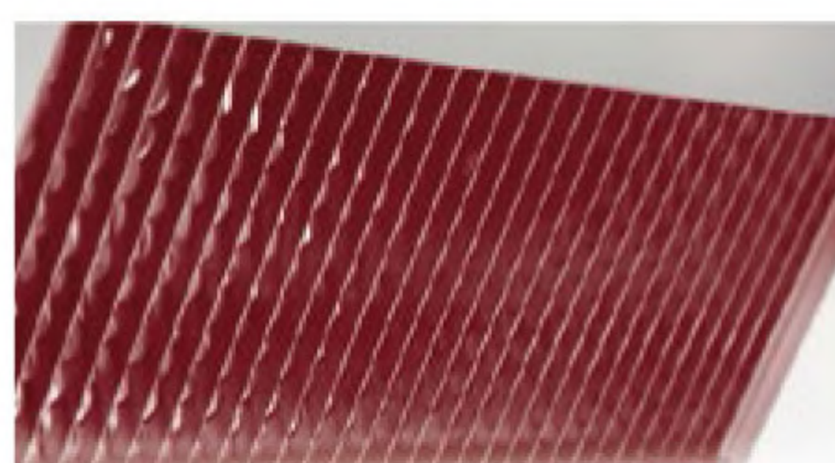
Teflon blades kit Kit lame teflonate Kit lames en téflon Kit hojas en teflón Комплект тефлоновых ножей