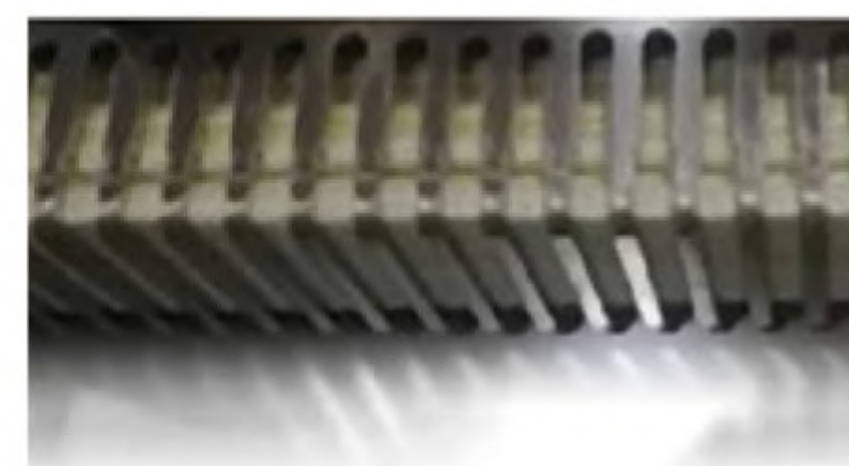
Blades lubrication kit Kit lubrificazione lame Kit lubrification lames Kit lubricación hojas Встроенная смазка ножей