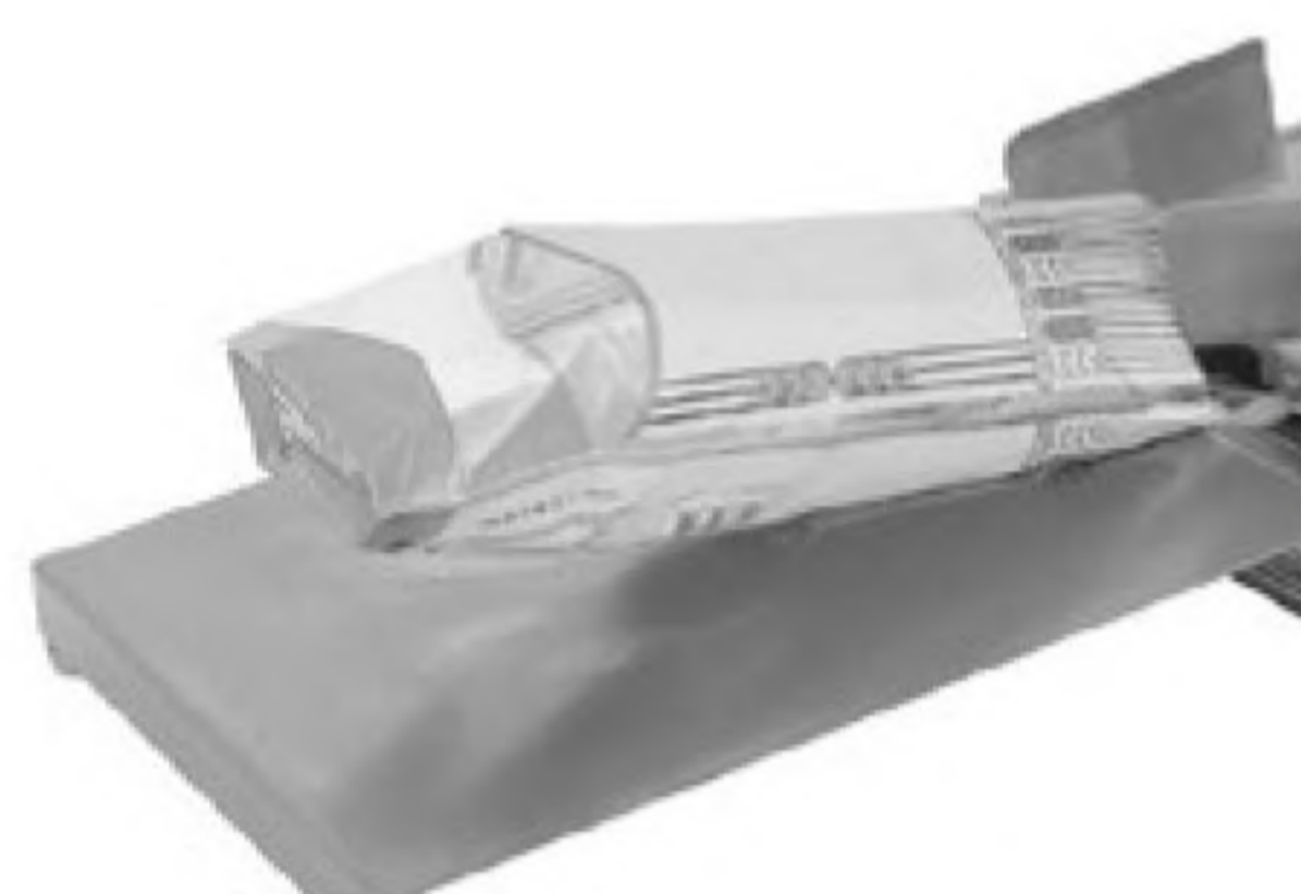
Bag blower Aprisacchetto Souffleur pour sachets Soplador para bolsa Устройство раздува пакетов