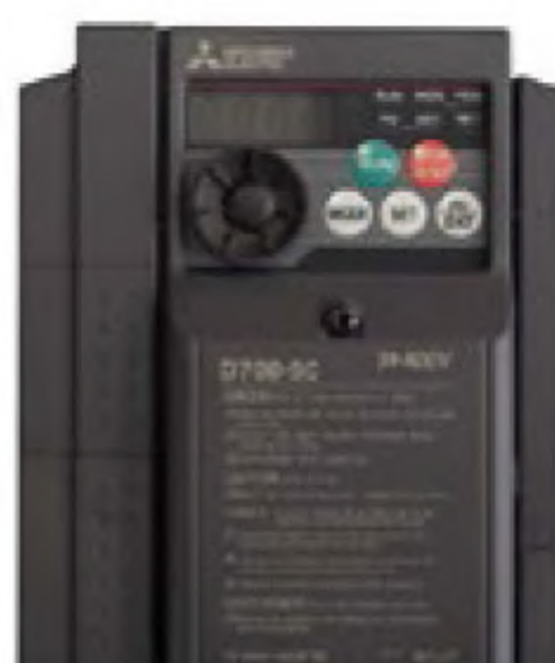
Single phase version with inverter Versione monofase con inverter Versión monofásica con inverter Однофазная версия с инвертором