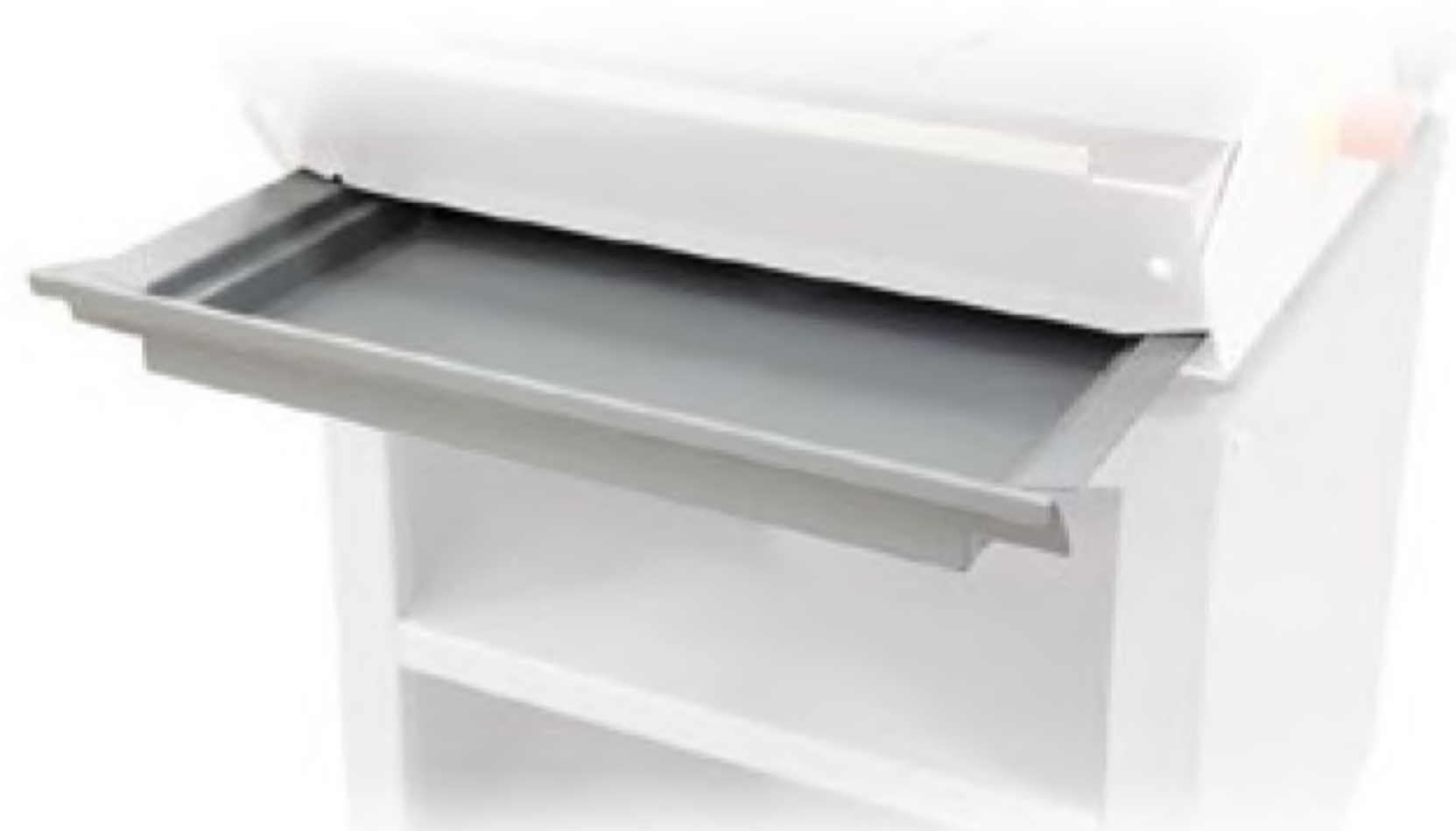
Breadcrumbs tray Vaschetta raccogli briciole Tiroir à miettes Cajón frontal para migas Выдвижной ящик для сбора крошек