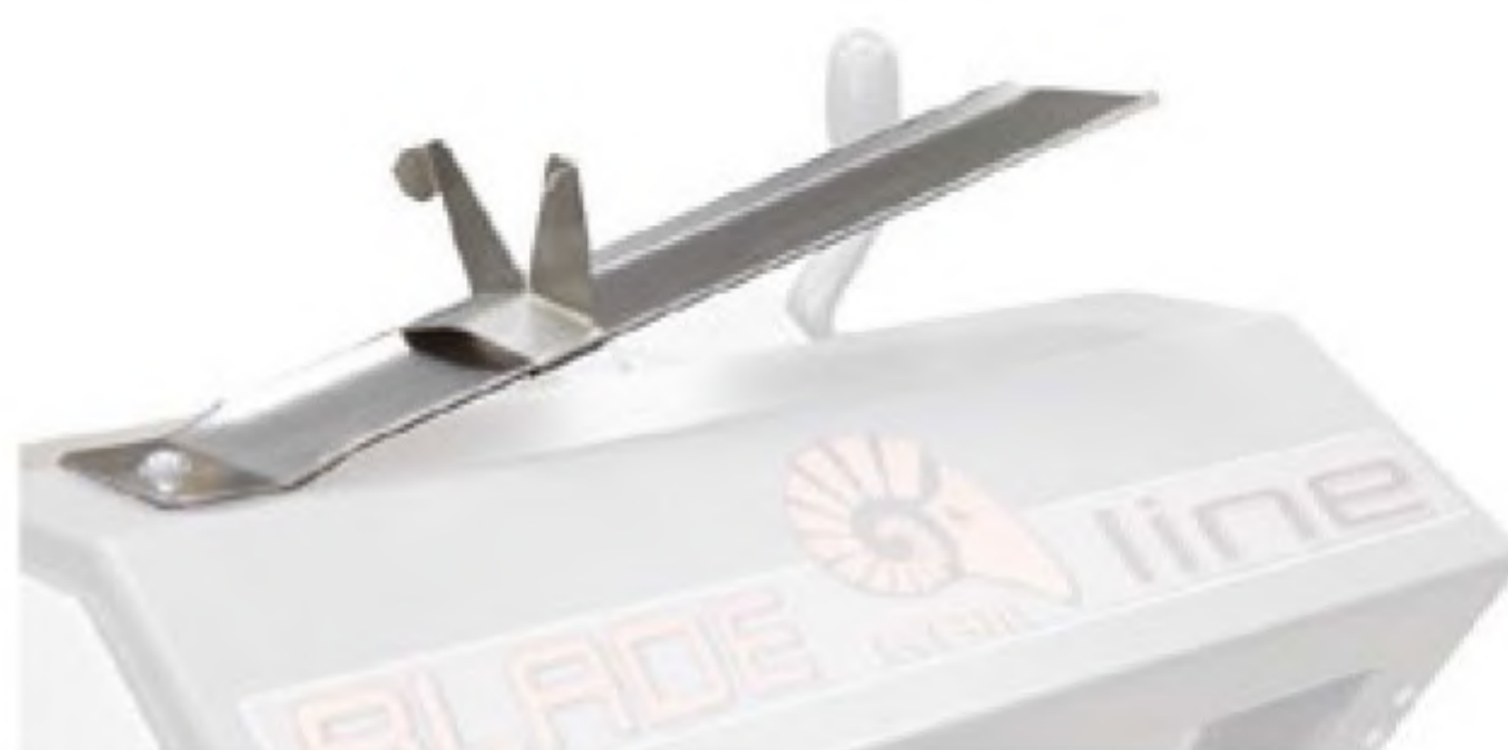
Stainless steel slide for bread packaging Scivolo in acciaio inox per imbustamento pane Rampe en acier inox pour emballage du pain Deslizadero en acero inox para embalaje del pan Планка из нержавеющей стали для упаковки