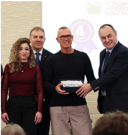
Volpato Quarto classificato