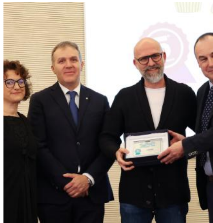
Tortamivia Quinto classificato