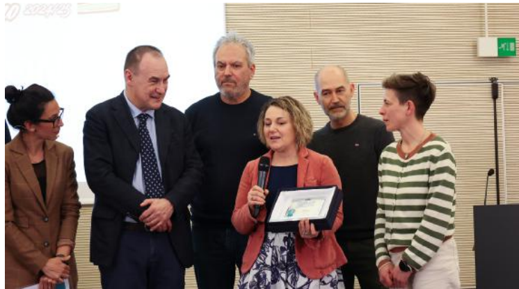
Gambarato Terzo classificato