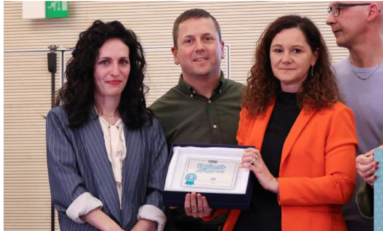
Da Loris I secondi classificati