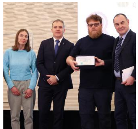
Casara Decimo classificato