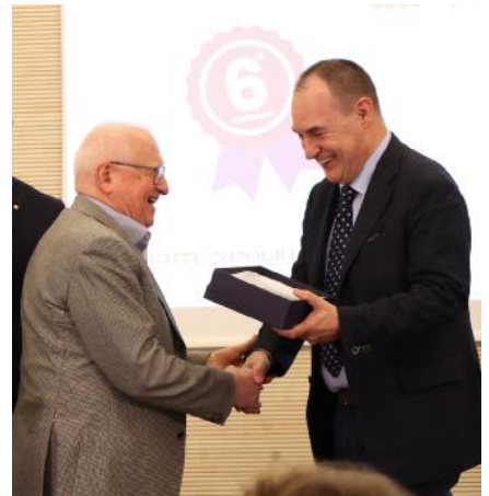
Campana Sesto classificato