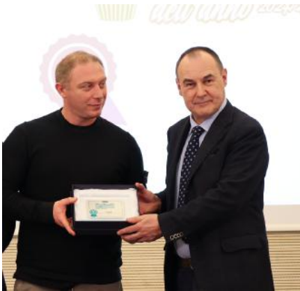
Marcon Settimo classificato