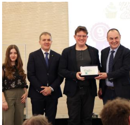
Baston Nono classificato